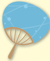
体温を下げるため