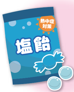
塩分・ミネラル補給のため