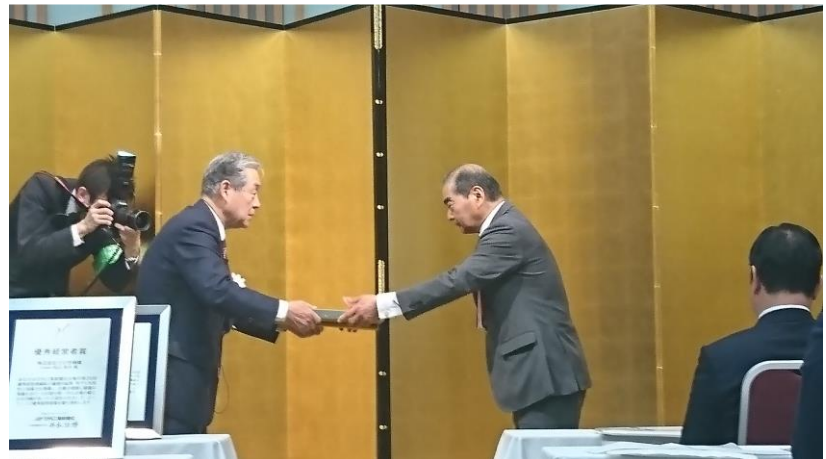
贈賞式にて表彰盾を受け取る当社会長